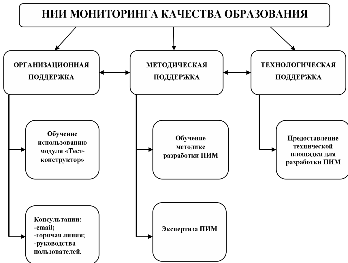
Рисунок 1 – Схема комплексной поддержки модуля «Тест-конструктор»

Рассмотрим основные особенности работы с модулем «Тест-конструктор».